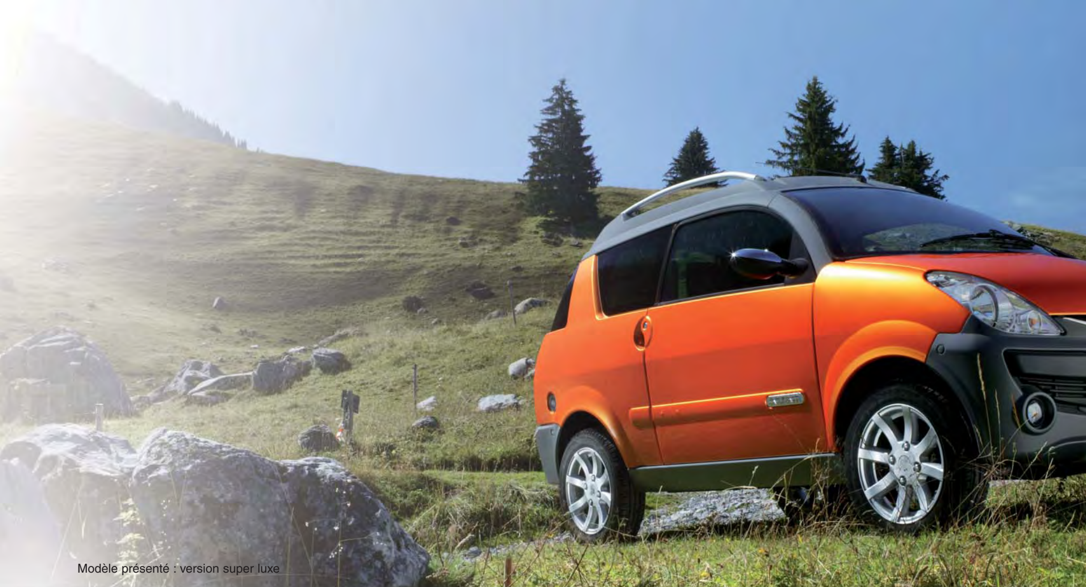
Modèle présenté : version super luxe